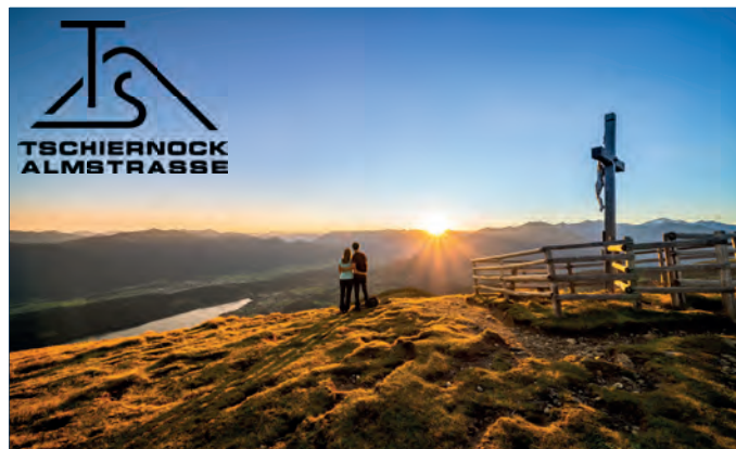
Wandern_Nockberge-Trail_Tschierwegernock_Millstätter See_Sommer.jpg

Bisher waren eigene Saisonkarten erhältlich. Aufgrund der gestiegenen Nachfrage nach einer unkomplizierten Lösung haben sich die Verantwortlichen für eine gemeinsame Kombikarte entschieden. Sie gilt von Mai bis Anfang November und ermöglicht die flexible Nutzung beider Panoramastraßen. Gipfel wie der Tschierweger Nock, der Kamplnock und der Tschiernock sowie bewirtschaftete Hütten wie die Sommereggerhütte, die Hansbauerhütte, die Schwaigerhütte, die Millstätter Hütte und die Alexanderhütte können damit beliebig oft erwandert oder direkt besucht werden.