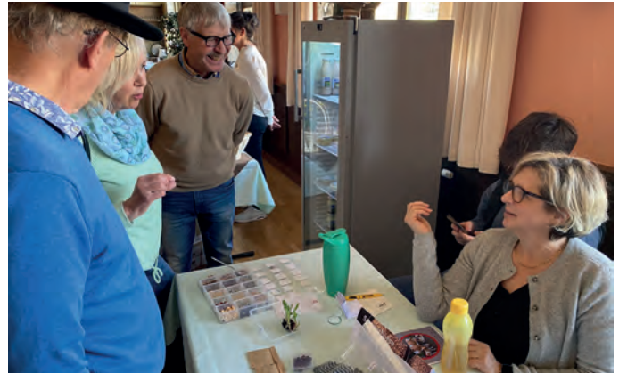
Die 5. Saatgutbörse war wieder ein Erfolg

Auch kulturell hat der Sommer einiges zu bieten: Der Theaterwagen Porcia macht wieder zweimal Halt im Seezentrum und sorgt für Theatergenuss vor beeindruckender Naturkulisse. Mit der neuen Koralmbahn eröffnet sich zudem die Chance, noch mehr Gäste für unsere Region zu begeistern. Denn rund um den Millstätter See gibt es viel zu entdecken. Gleichzeitig arbeiten wir gemeinsam mit der Gemeinde an weiteren Projekten im Seezentrum.