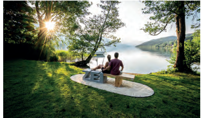
ZEITplatz - Das ZEITgeschenk des Barons