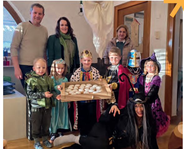
Fasching im Kindergarten Treffling

Beide Modelle bieten Familien wertvolle Unterstützung – je nach persönlichem Bedarf.