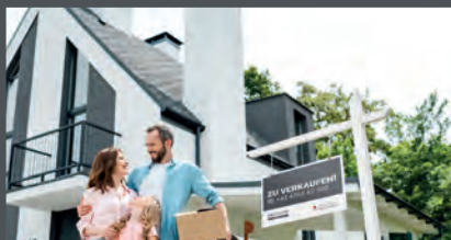
Sie wollen Ihre Immobilie verkaufen? Wir stehen Ihnen professionell und engagiert zur Seite - kontaktieren Sie uns!