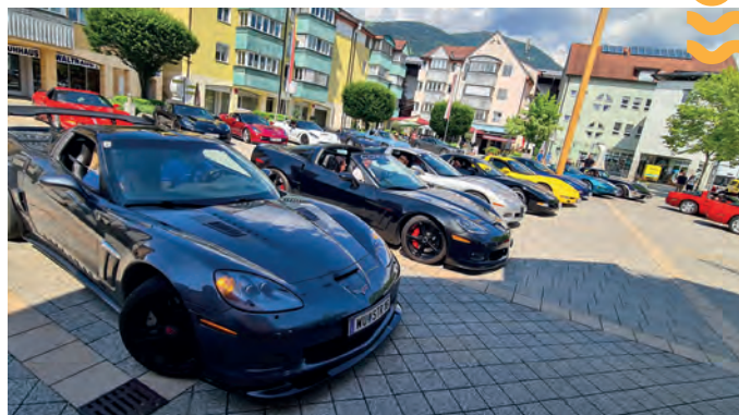
Corvette-Treffen - Besichtigung am Hauptplatz

Die Teilnehmer erwartet heuer ein abwechslungsreiches Programm: Neben einer interessanten Ausfahrt ins Zollfeld stehen auch Touren in die Nachbarländer Slowenien und Italien auf dem Programm. Den traditionellen Abschluss bildet der gemeinsame Abend im Gasthaus Bärwald.